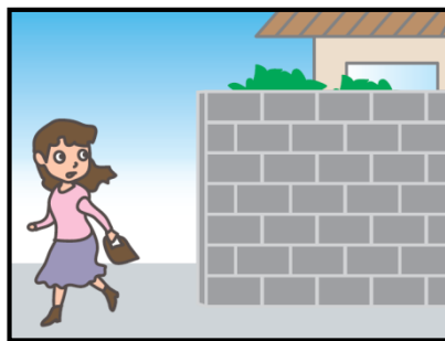
危ない場所から離れて！