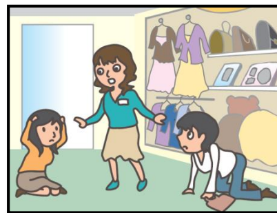
お店では、あわてず係員の指示に従って！