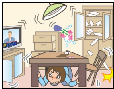
頭を守って、安全な場所に避難！

緊急地震速報を見聞きしたときの行動は、まわりの人に声をかけながら「周囲の状況に応じて、あわてずに、まず身の安全を確保する」ことが基本です。